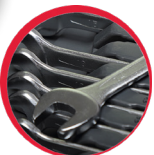
Zestaw kluczy oczkowo-płaskich