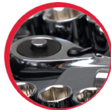
Grzechotki 1/2", 3/8", 1/4" 72 zęby