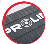
Logo PROLINE tłoczone na kufrze